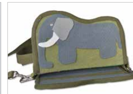
MARTYNA FILIPCZAK Tytuł pracy: Boaerka ZSP Częstochowa / Projektowanie Graficzne