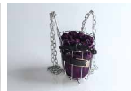
KAROLINA SZUDUCZYŃSKA Tytuł pracy: Armadillo PLSP Zamość / Projektowanie Graficzne