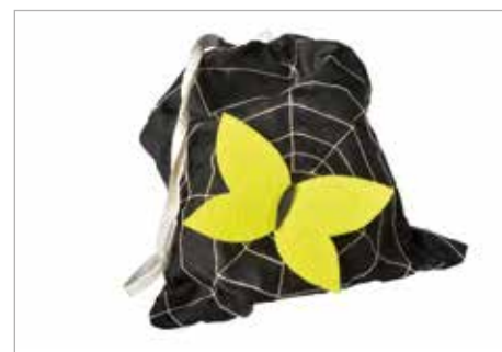
JOLANTA BUCZKOWSKA Tytuł pracy: Arachnowór ZSP Częstochowa / Projektowanie Graficzne