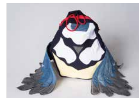
KAJA WASILEWSKA Tytuł pracy: Sikorka ZSP Koszalin / Tkanina Artystyczna