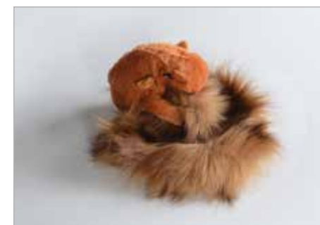
WIKTORIA NOWACKA Tytuł pracy: Śpiąca wiewiórka LSP Słupsk / Projektowanie Wyrobów Artystycznych