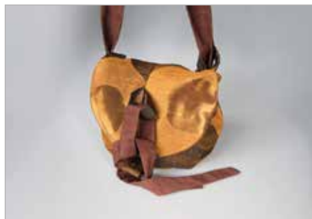
ZUZANNA KLĘK Tytuł pracy: Torbak - Koala PLSP Zduńska Wola / Projektowanie Ubioru