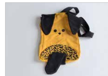
EWELINA WOLSKA Tytuł pracy: lemur tygrysi PLSP Zakopane / Projektowanie Graficzne