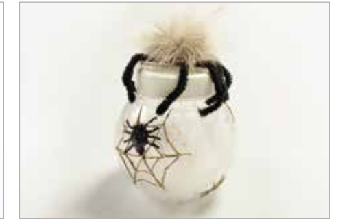
NATALIA KANIOWSKA Tytuł pracy: Pająk ZSP Częstochowa / Projektowanie Graficzne