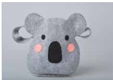
DOMINIKA DRZAZGA Tytuł pracy: Kolo ZSP Częstochowa / Projektowanie Graficzne