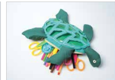
LAURA HŁOND Tytuł pracy: Piórnik Turtle ZSP Częstochowa / Projektowanie Graficzne