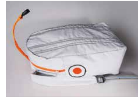
WERONIKA PIEKARSKA Tytuł pracy: Torbak-wieloryb LSP Kraków / Projektowanie Przestrzeni Wystawienniczej