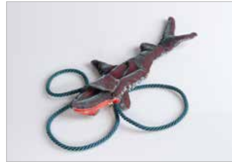
DOMINIKA BARZOWSKA Tytuł pracy: Rekin LSP Słupsk / Projektowanie Wyrobów Artystycznych