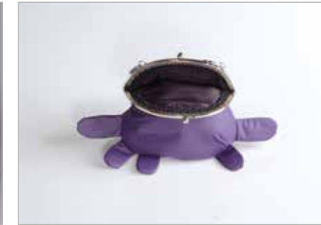
KLAUDIA GRZEGORZEWICZ Tytuł pracy: Krab kieszonkowy LSP Słupsk / Projektowanie Wyrobów Artystycznych