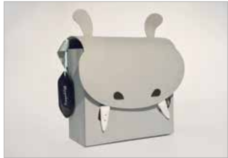
JOANNA GÓRNIAK Tytuł pracy: Hippobag ZSP Częstochowa / Projektowanie Graficzne