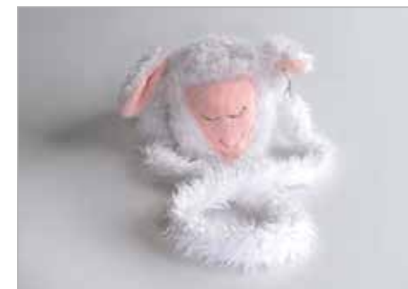
URSZULA TKACZ Tytuł pracy: Balbina LSP Słupsk / Projektowanie Wyrobów Artystycznych