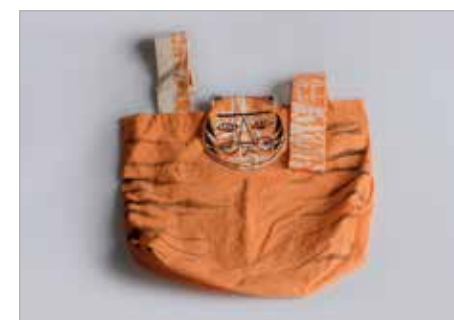
MAJA OWCZARZ Tytuł pracy: Torbo-tygrys POSSP Bielsko-Biała / Tkanina Artystyczna