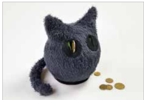
LILU POLICIŃSKA Tytuł pracy: Skarbotek ZSP Częstochowa / Projektowanie Graficzne