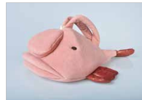
MARTYNA GZEL Tytuł pracy: Blobfish ZSP Częstochowa / Projektowanie Graficzne