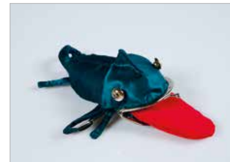
KAROLINA KOZŁOWSKA Tytuł pracy: Kameleo ZSP Częstochowa / Projektowanie Graficzne