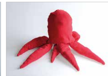
EMILIA KUBIK Tytuł pracy: Torbonica ZPSP Łódź / Projektowanie Wyrobów Artystycznych