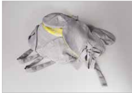
JULIA OPAŁKA Tytuł pracy: Torbak - Koala PLSP Zduńska Wola / Projektowanie Ubioru