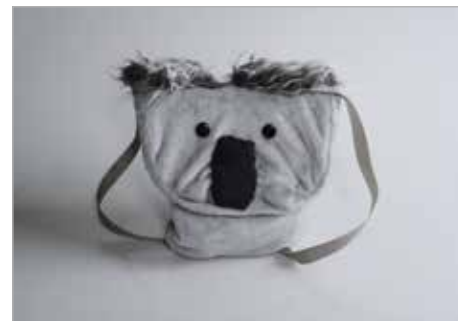
JULIA GŁUSZEK Tytuł pracy: Koalapak OSSP Nysa / Projektowanie Graficzne