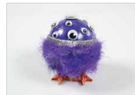
ŁUCJA RUSEK Tytuł pracy: Pudekczak ZSP Częstochowa / Projektowanie Graficzne