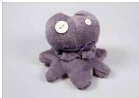
KAMILA MĘCIK Tytuł pracy: Octoplush ZSP Częstochowa / Projektowanie Graficzne