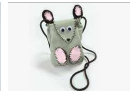
NICOLE KNYSAK Tytuł pracy: Śmiesznotka ZSP Częstochowa / Projektowanie Graficzne