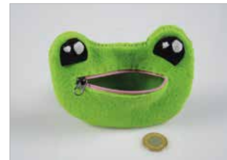
ALEKSANDRA TARGOŃSKA Tytuł pracy: Zabonetka ZSP Częstochowa / Projektowanie Graficzne